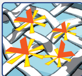
...a štěpí je na menší části.