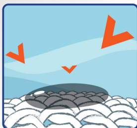
Enzymový systém působí na skvrny...

Vysoce účinné složení, které skvěle odstraňuje a čistí i ty nejnáročnější skvrny, se kterými se profesionálové často setkávají.